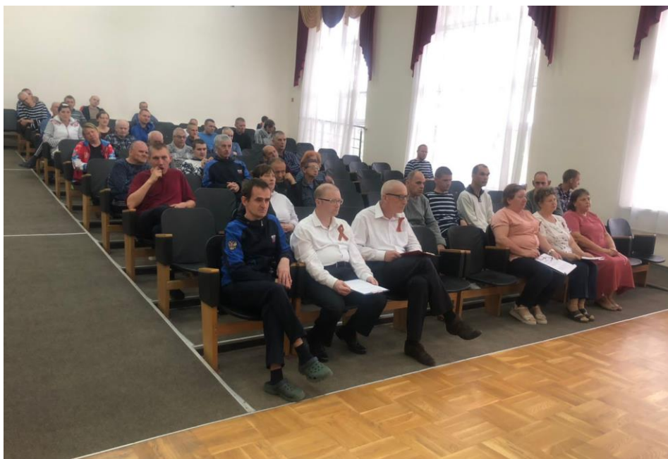
Актальный зал Северского интерната. Трансляция видеороликов, посвященных Дню единых действий в память о геноциде советского народа нацистами и их пособниками в годы Великой Отечественной войны. 19 апреля 2024 года