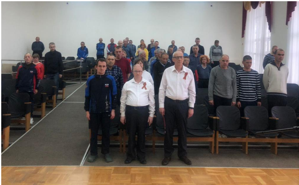
Актный зал Северского интерната. Минута молчания в память о геноциде советского народа нацистами и их пособниками в годы Великой Отечественной войны. 19 апреля 2024 года