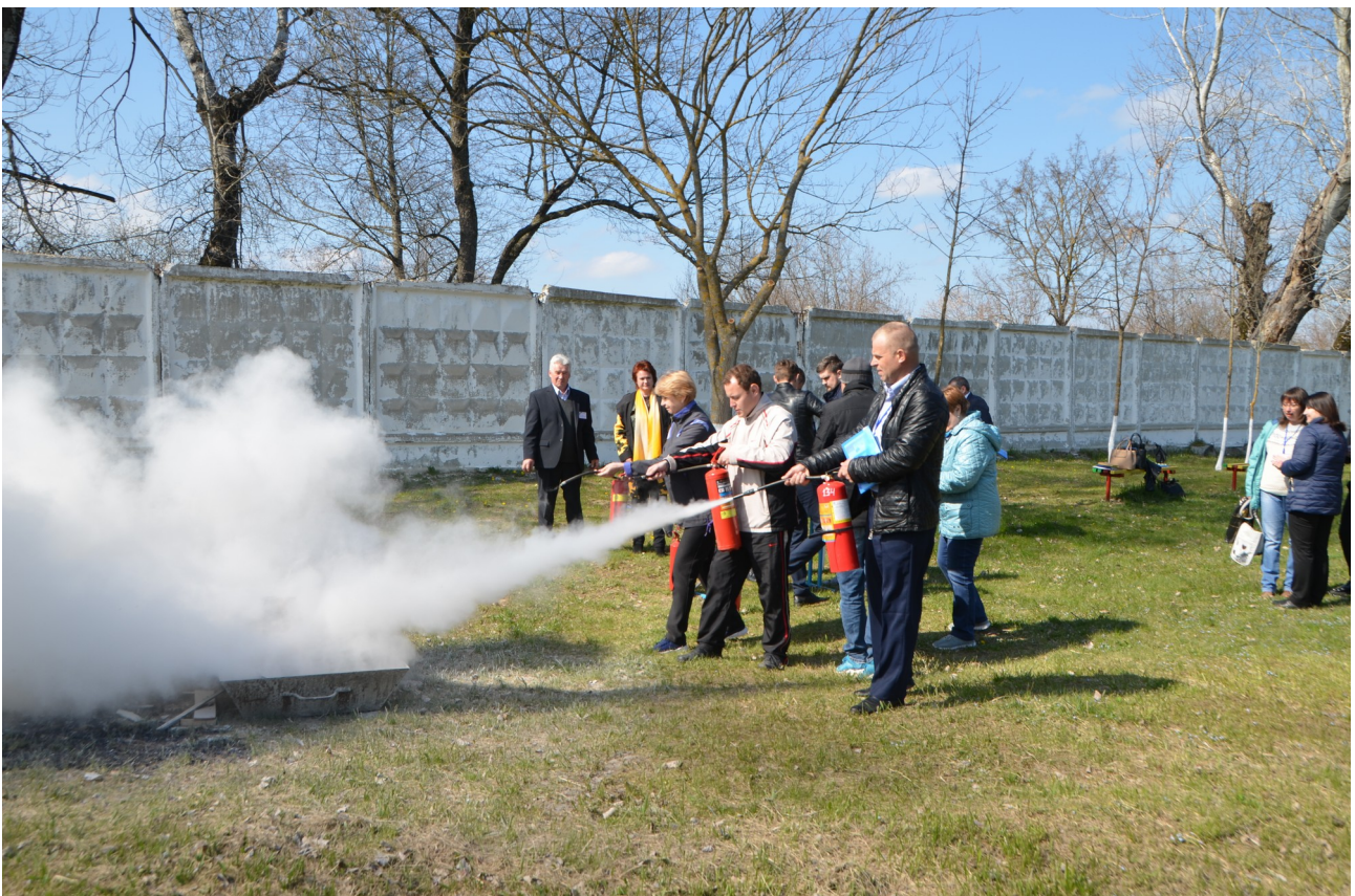
Участники занятий продемонстрировали умение обращаться с огнетушителями