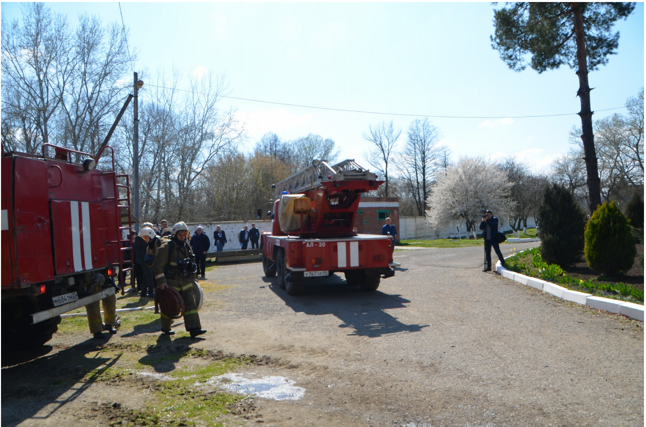
Пожарный расчет прибыл на локализацию очага возгорания.