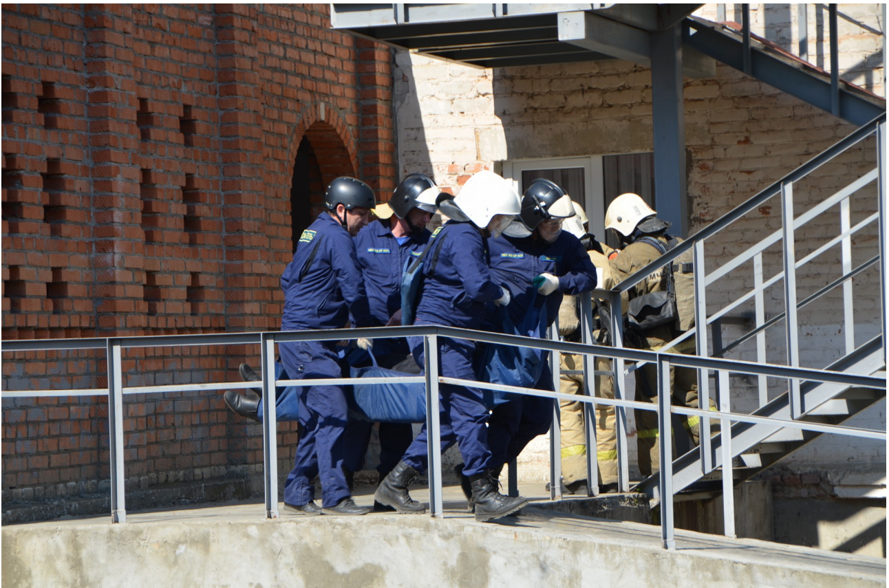
Сотрудники МЧС проводят эвакуацию пострадавшего во время пожара.