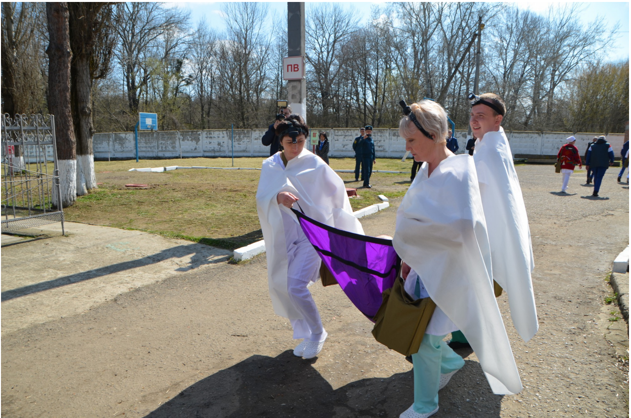
Эвакуация инвалидов сотрудниками интерната.