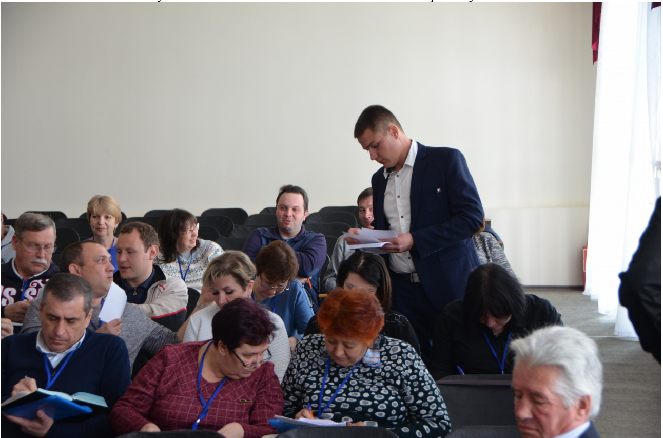
Для участников практических занятий провели тестирование.