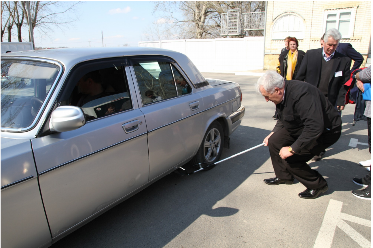
Сотрудник ЧОПа демонстрирует пользование досмотровым зеркалом.