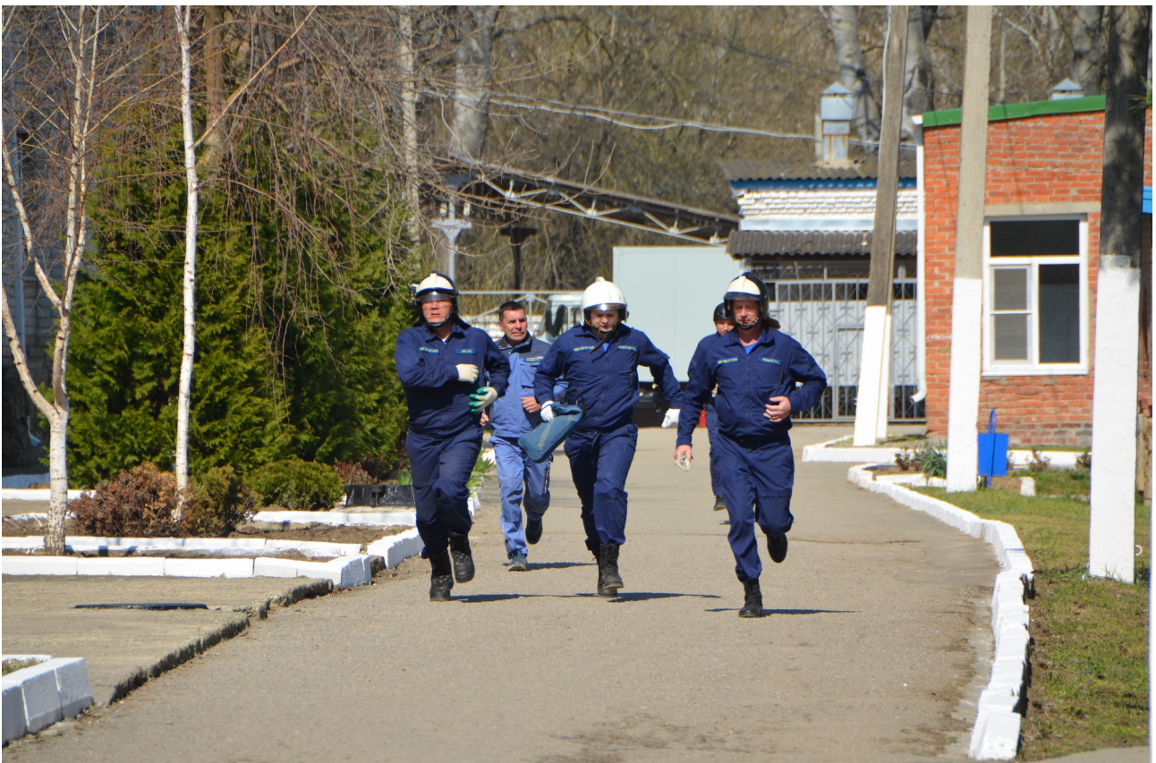
Аварийно-спасательный отряд прибыл к месту возгорания.