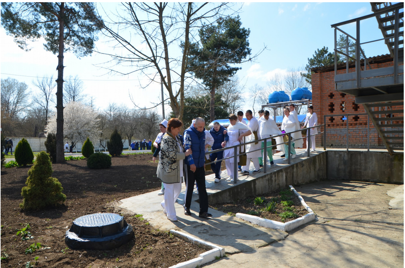
Эвакуация инвалидов сотрудниками интерната.