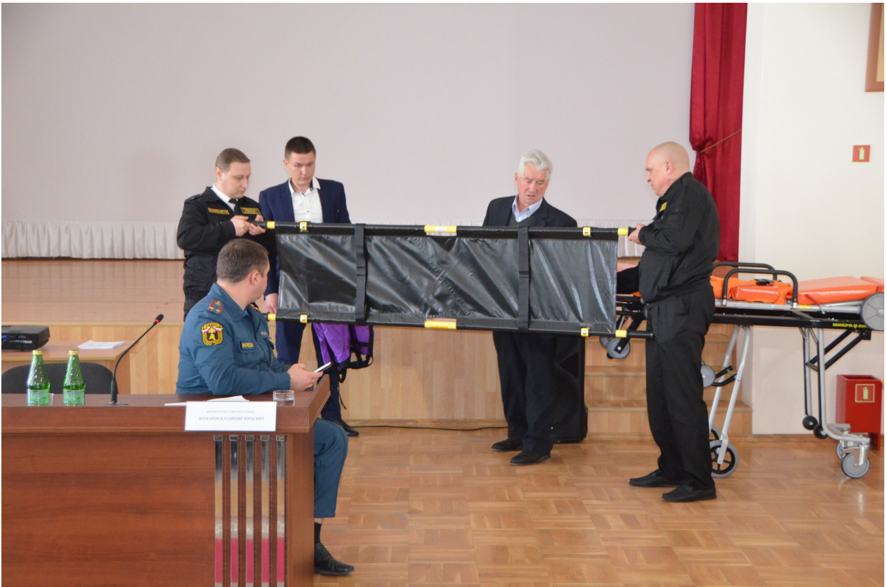
Проводится демонстрация по применению и пользованию складных носилок.