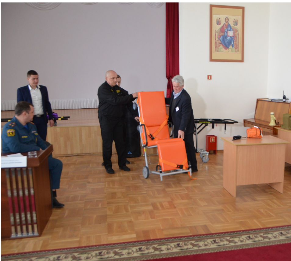
Проводится демонстрация по применению и пользованию тележки-каталки.