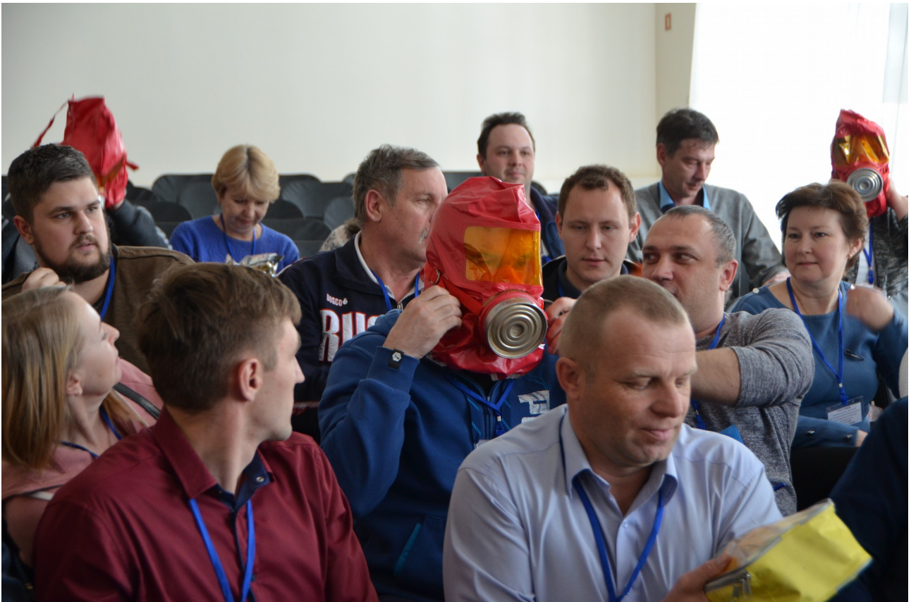
Участники занятий отрабатывают практические навыки по применению средств индивидуальной защиты газодымозащитного комплекта «Бриз-3401»