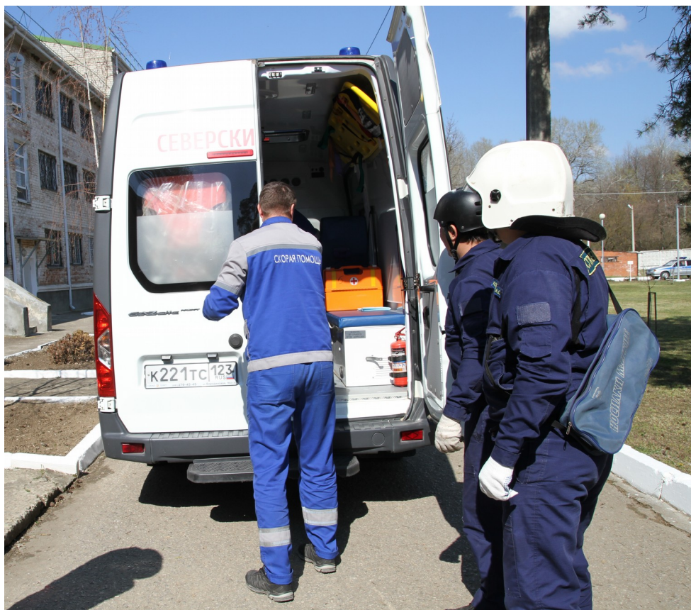
Сотрудники МЧС и скорой помощи госпитализируют пострадавшего во время пожара.