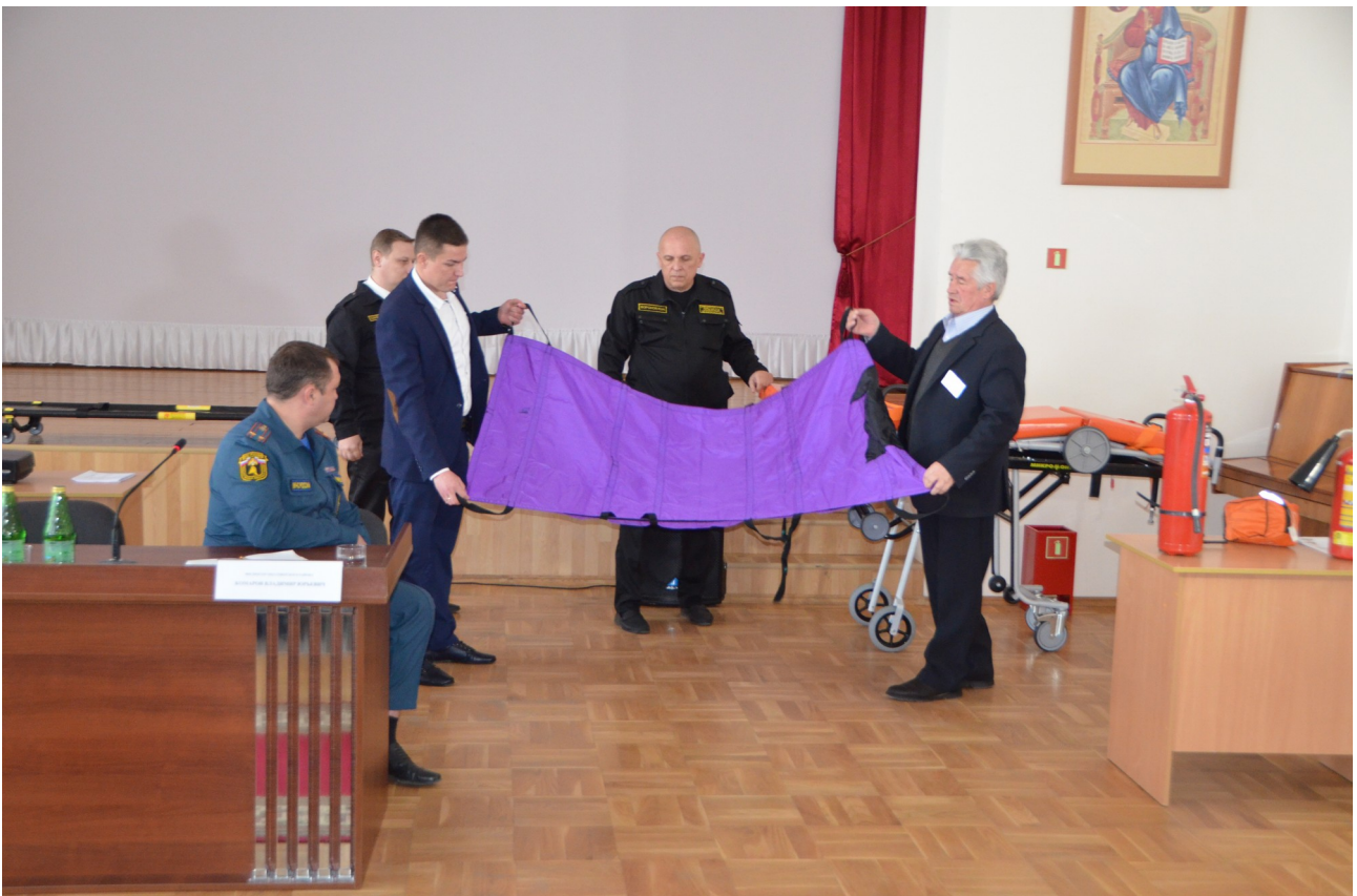
Проводится демонстрация по применению и пользованию мягких носилок.