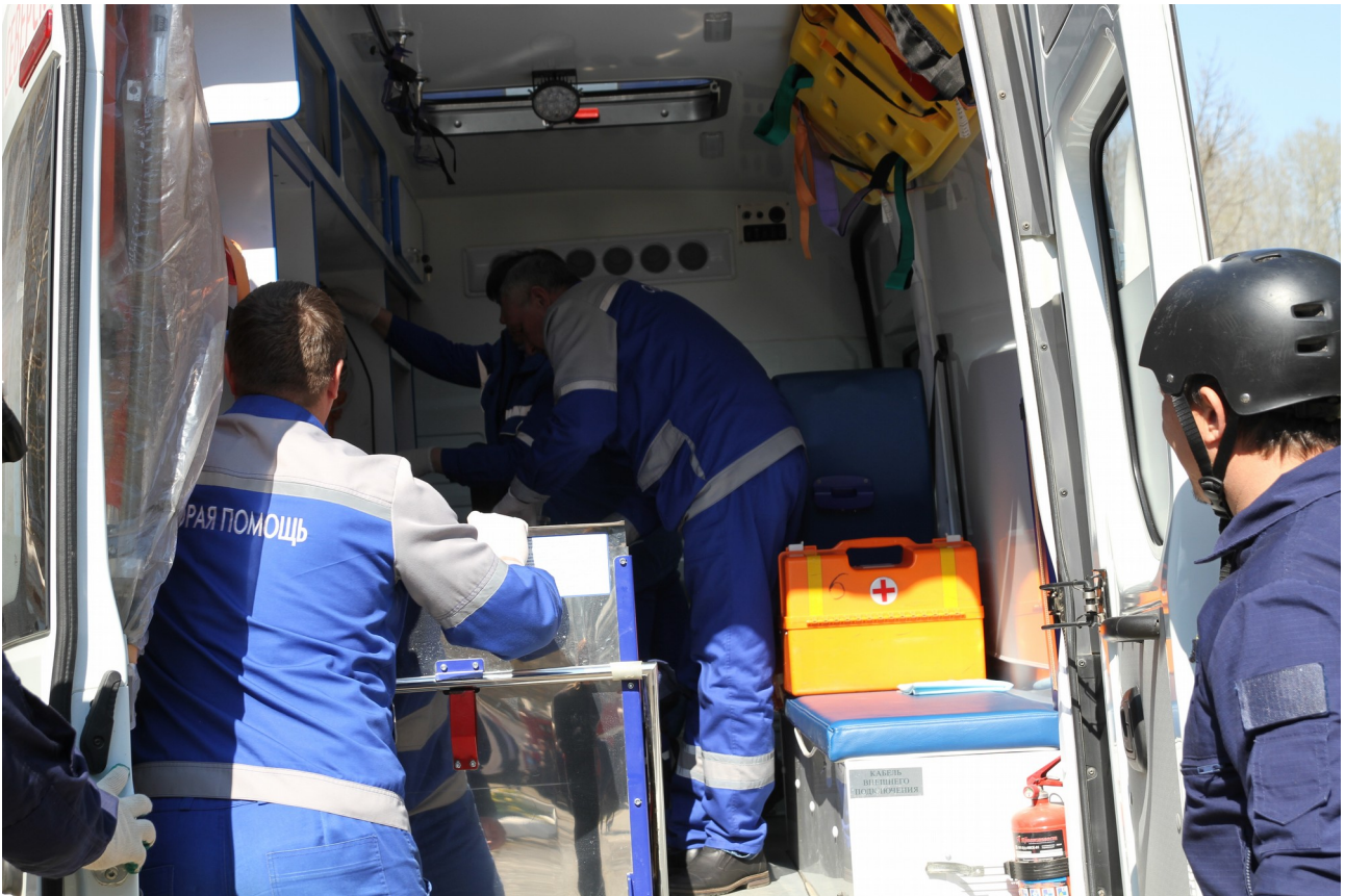
Сотрудники МЧС и скорой помощи госпитализируют пострадавшего во время пожара.