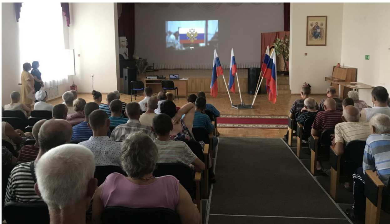
Просмотр видеоролика «Наш трехцветный флаг»