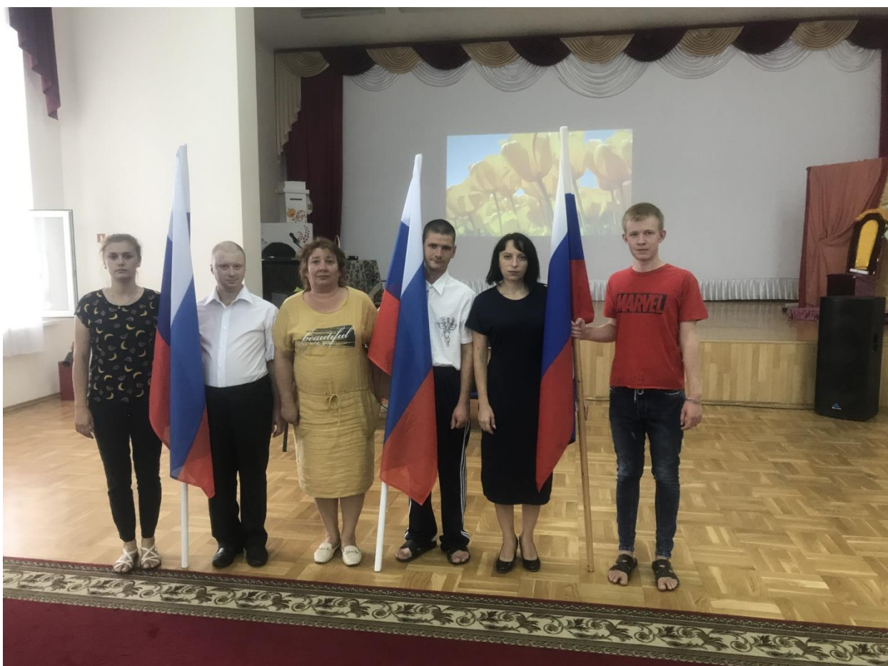
Сотрудники и инвалиды интерната торжественно открыли праздничное мероприятие.

Флагу России 22 августа 2019 года исполнилось 350 лет. Инвалиды Северского интерната отметили этот праздник вместе со всей страной. Ни один всенародный праздник в России не обходится без поднятия Государственного флага. Российский триколор имеет историю, уходящую в глубь веков. В актовом зале состоялось мероприятие для инвалидов: «Под флагом России». В начале мероприятия в торжественной обстановке инвалидами был внесен флаг Российского государства.