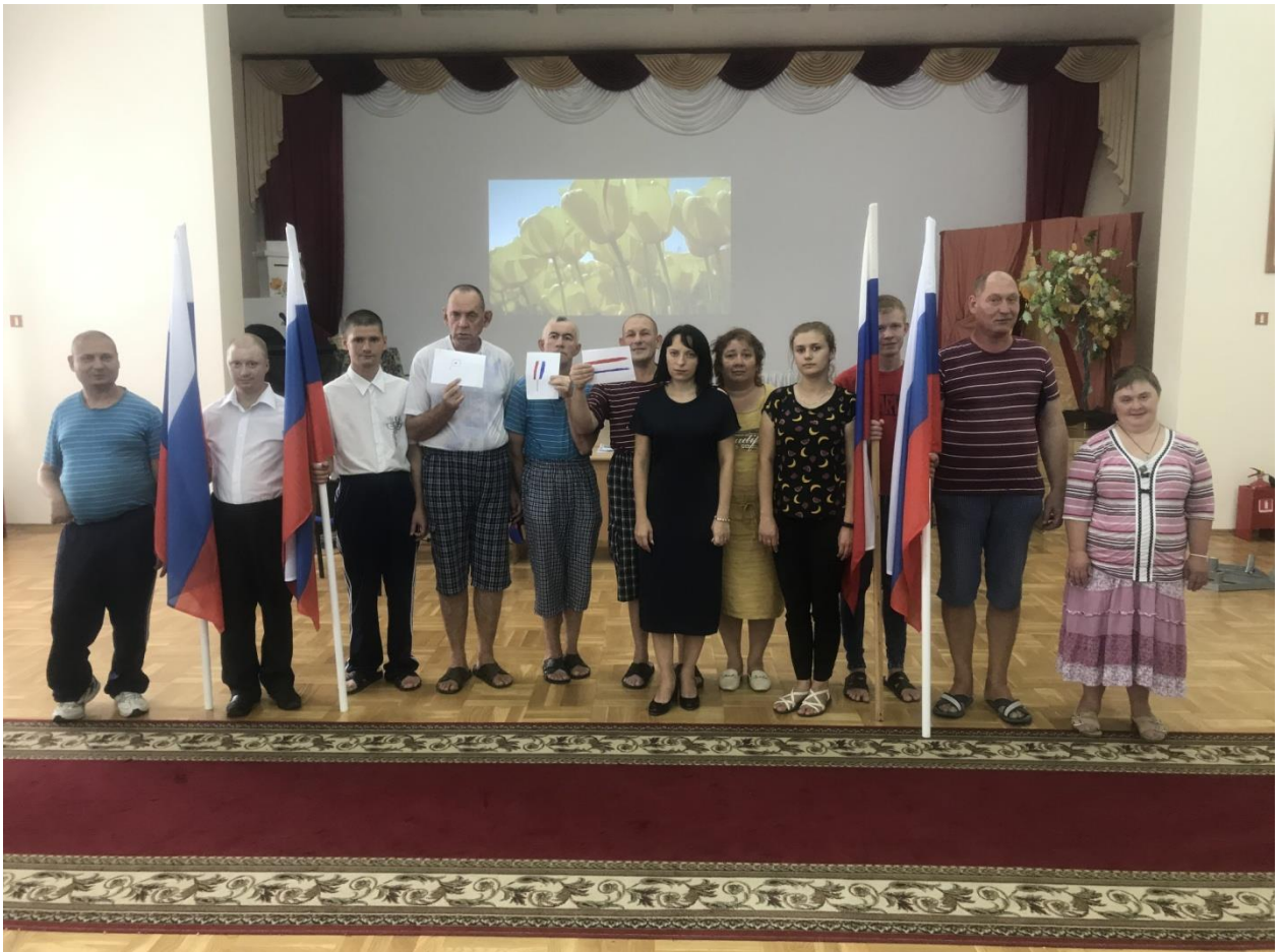
Участники мероприятия «Под флагом России» с сотрудниками интерната.